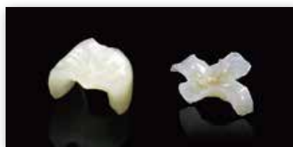
イニシャル C (インレー)